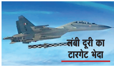
लंबी दूरी का टारगेट भेदा

नई दिल्ली (एजेंसी)। भारत ने सुखोई 30 एमकेआई लड़ाकू विमान से ब्रह्मोस एयर लॉन्च मिसाइल के विस्तारित रेंज वर्जन का सफलतापूर्वक परीक्षण किया। विमान से प्रक्षेपण योजना के अनुसार था और मिसाइल ने बंगाल की खाड़ी क्षेत्र में टारगेट पर सीधा प्रहार किया। एयरफोर्स ने बताया कि यह एसयू 30 एमकेआई विमान से ब्रह्मोस मिसाइल के विस्तारित रेंज वर्जन का पहला प्रक्षेपण था।